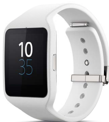
SmartWatch 3 SWR50

Die SmartWatch 3 SWR50 ist der perfekte Begleiter für alle Situationen im Leben. Egal ob beim Sport oder bei einem festlichen Event, die SmartWatch 3 SWR50 kann man immer tragen. Perfekte Wasserdichtigkeit (IP68), GPS-Funktion und das Hören von Musik ohne Verbindung zum Smartphone, die übersichtliche Darstellung verschiedener Aktivitäten und Android Wear machen die SmartWatch 3 SWR50 zur idealen SmartWear für alle, die nie den Überblick verlieren möchten.