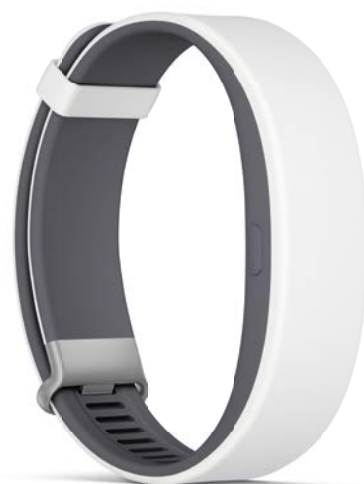
SmartBand 2 SWR12

Erfahren Sie mit dem innovativen SmartBand 2 SWR12 noch mehr über sich selbst und Ihre Angewohnheiten. Mit dem integrierten Aktivitätstracker bleiben Sie immer auf dem Laufenden und wissen, wie weit Sie gegangen oder gelaufen sind, welche Distanz Sie mit dem Fahrrad zurückgelegt haben und vieles mehr. Der optische Herzfrequenzmesser bietet Ihnen die Möglichkeit, Ihren Herzschlag aufzuzeichnen und dessen Schwankungen innerhalb eines Tages zu analysieren. So können Sie schnell und einfach herausfinden, wie verschiedene Aktivitäten auf Ihren Körper wirken. Zusammen mit einer Akkulaufzeit von bis zu 5 Tagen und dem wasserdichten sowie farblich flexiblen Design ist das SmartBand 2 SWR12 der perfekte Begleiter für jeden Anlass – egal ob beim Sport oder im Büro.