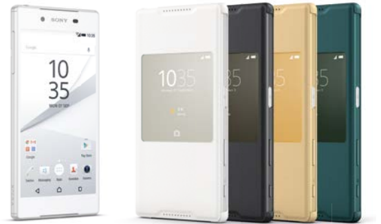
Smart Style Cover SCR44

Mit dem Smart Style Cover für die Xperia™ Z5 Serie von Sony können Sie Ihr Smartphone auch bei geschlossenem Zustand sehr leicht bedienen – Uhrzeit checken, Nachrichten lesen, die Wetterverhältnisse nachschauen und noch vieles mehr. Das schlanke, stilvolle Design macht es extrem flexibel und schützt Ihr Xperia™ Z5 optimal gegen Kratzer und kleinere Stöße. Gleichzeitig können Sie jederzeit mit Ihrem Smartphone interagieren. Die Smart-Window-Funktion des Covers ermöglicht es Ihnen, ausgewählte Widgets und Apps zu sehen und zu bedienen – selbst wenn es geschlossen ist. Sie können zum Beispiel einen Anruf entgegennehmen oder die Musikwiedergabe steuern, ohne das Cover öffnen zu müssen. So lässt sich Ihr Smartphone uneingeschränkt nutzen und ist gleichzeitig geschützt.