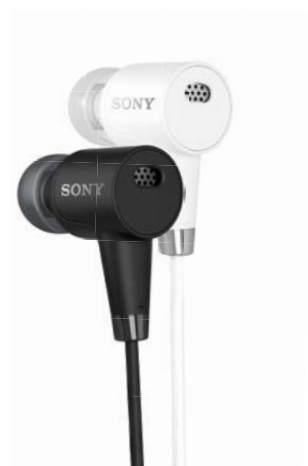
Headset mit DNC MDR-NC750

Genießen Sie Ihre Lieblingsmusik in einzigartiger Qualität, egal wie laut es um Sie herum ist. Ausgestattet mit High-Res Audio erleben Sie mit dem Headset mit DNC Musik in unvergleichbarer Klangqualität – als wären Sie mit dem Künstler im Tonstudio. Die integrierte Beat Response Control sorgt für eine ausgewogene Balance sowie kräftige Bässe, was vor allem tiefenorientierten Musikrichtungen zugutekommt. Für den puren Genuss sorgt die digitale Geräuschminimierung (DNC), die alle störenden Umgebungsgeräusche kurzerhand in den Hintergrund stellt. So können Sie sich voll und ganz von jedem Ton im Takt treiben lassen.