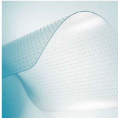
Für Teppichböden mit Ankernoppen