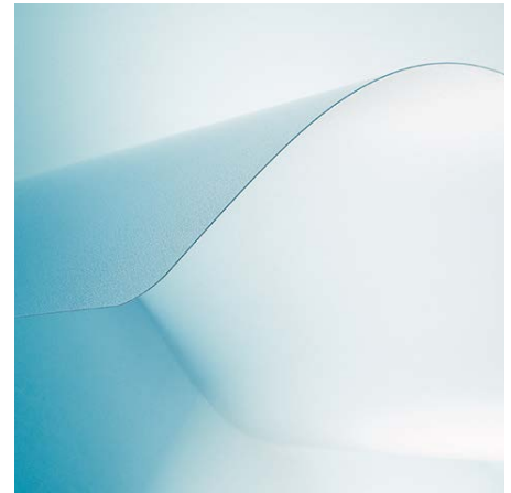
Für Hartböden mit VAB®-Haftschrift