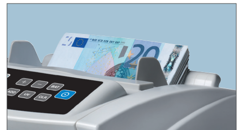
GESCHWINDIGKEIT VON 1.000 SCHEINE/MINUTE